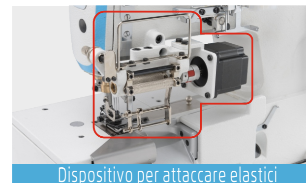
Dispositivo per attaccare elastici