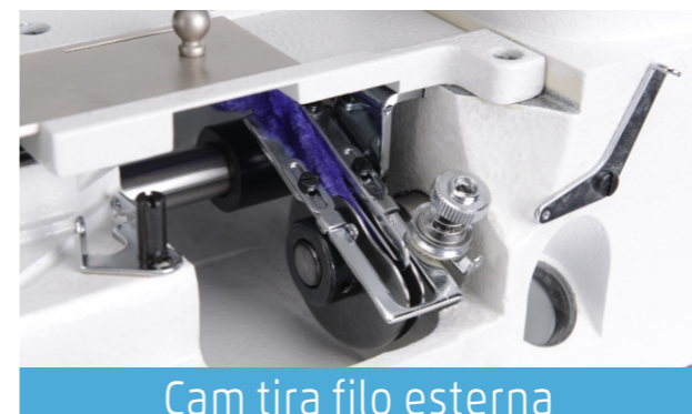
Cam tira filo esterna