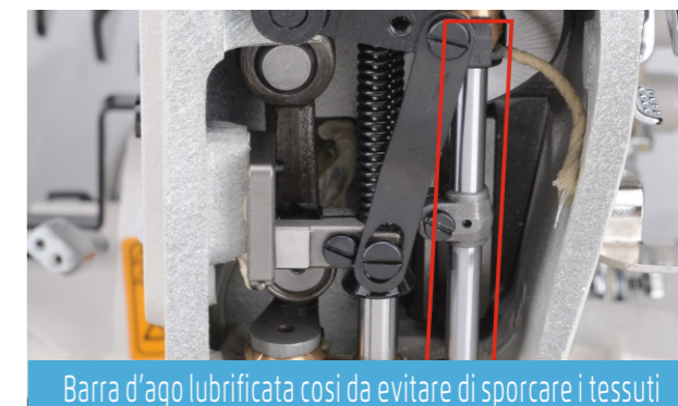
Barra d'ago lubrificata così da evitare di sporcare i tessuti