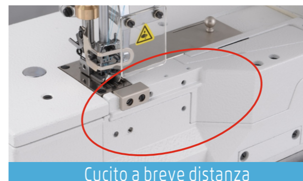
Cucito a breve distanza

Meccanica ed elettronica integrata, permettono di rendere la macchina più facile da operare